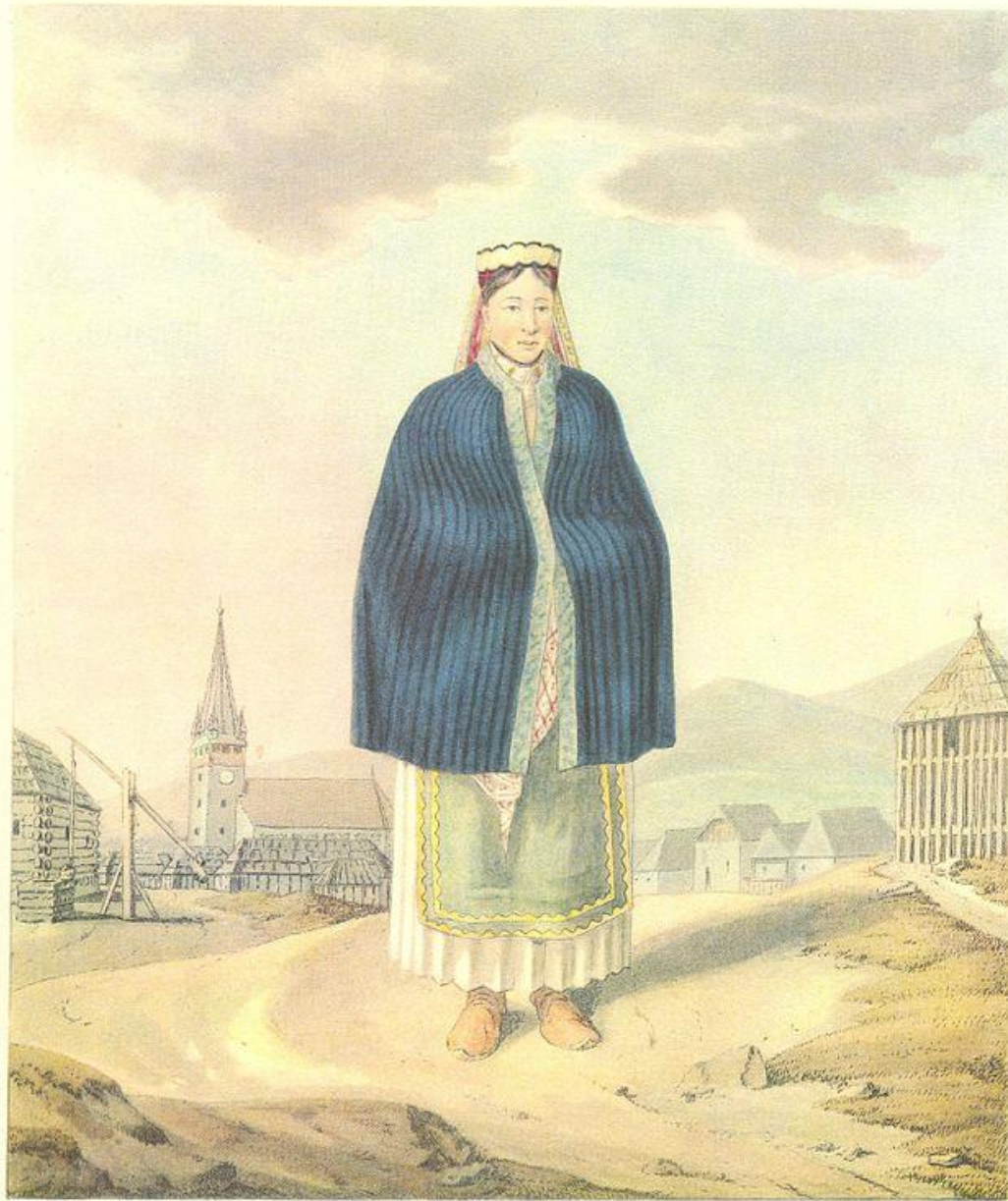
Ein Mädchen im Sonntagsputz von Torontzko, in Siebenbürgen.