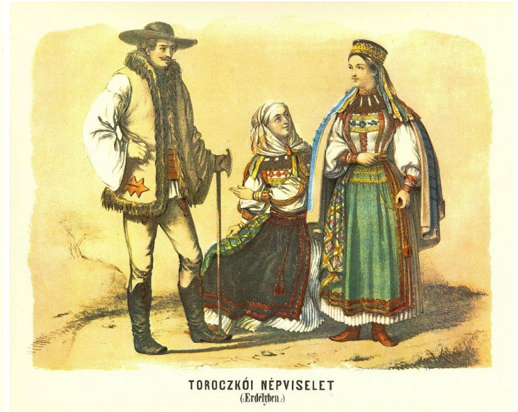
TOROCZKÓI NÉPVISELET (Erdélyben.)